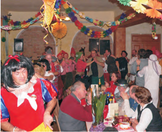
Das Gschnas findet traditionell immer am Faschingsmontag statt (Bilder aus 2008).

Im abgelaufenen Jahr hatten wir im Dorfwiazhaus 121 Veranstaltungen. Da gab es - auch wenn wir nicht immer selbst Veranstalter waren - eine Menge zu tun.