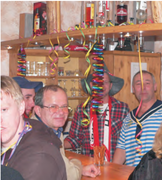
In unserer gemütlich eingerichteten Bar geht es bei den Festen bis in die frühen Morgenstunden immer recht lustig zu.